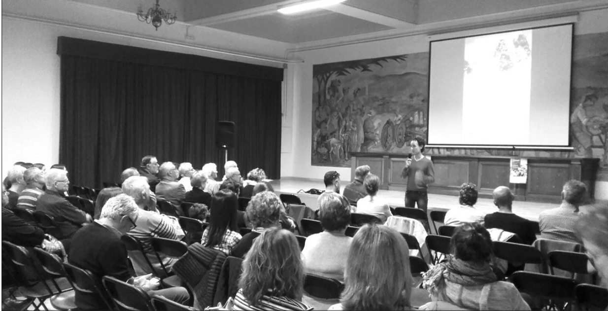
La projecció es va fer a l'auditori del centre.